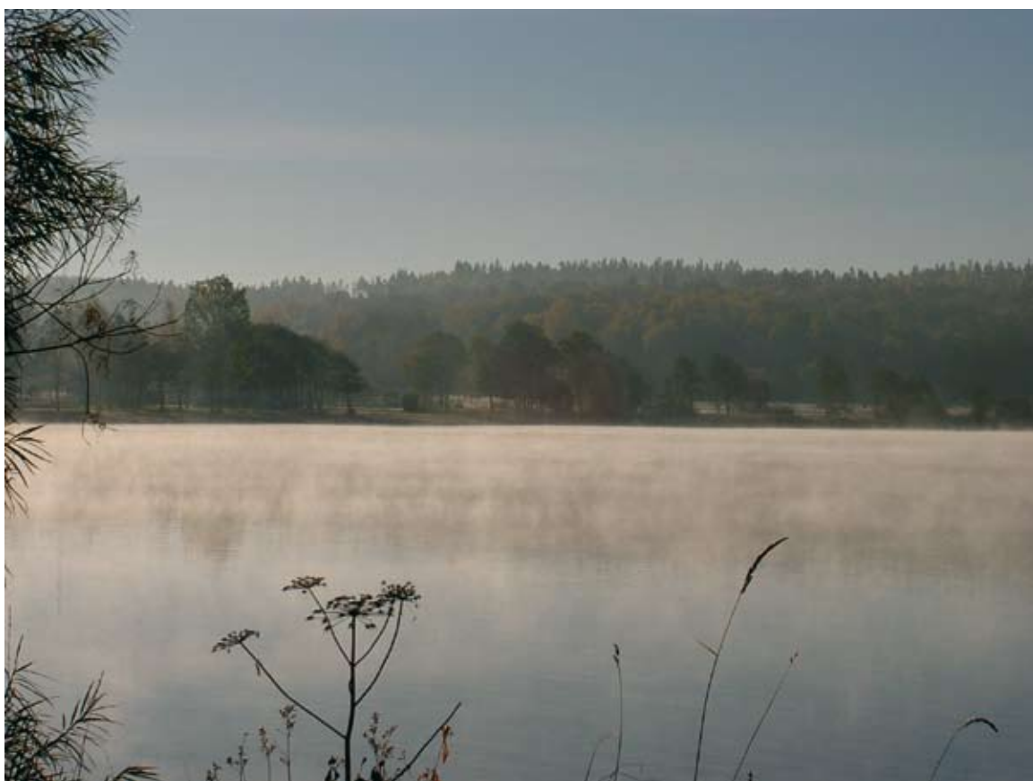
Utsikt från piren i sjön Mjörn mot badstranden och Rådmanskulle i Stadsskogen

8 moderna villor i anrik miljö nära Mjörn