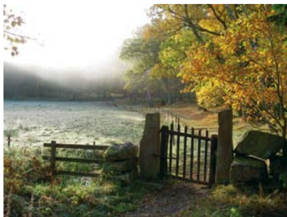
Grinden mot Bryngenäs vid Skår

Stadsskogen har storslagen natur med bergsrygg som skall bebyggas och dalgångar med bäckar och blandskog som förblir obebyggda naturstråk. Namnet Stadsskogen härstammar från 1700-talet då varje fastighet i staden ägde en skogslott för att ta sten till husgrund, timmer till byggvirke och med tiden hugga ved för vintervärmen. Den nya bebyggelsen skall anpassas till terrängen, skogen glesas ur för att öppna upp gläntor och skapa parkmiljöer med lövträd.