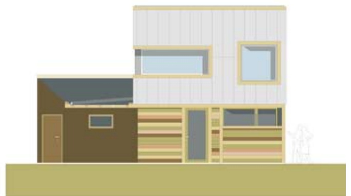
Fasad mot gård Hus 1-6