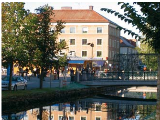
Lillån vid torget

Lillån och Sæveån som rinner genom stan mynnar i sjön Mjörn, västsveriges största insjö med rent vatten, femtio öar och holmar samt otaliga uddar och vikar att utforska. Mjörn ger Alingsås en egen skärgård. En sommar som den vi just upplevt ger möjligheter till fantastisk rekreation i och kring Alingsås.