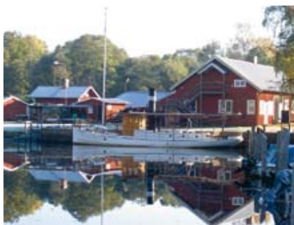
Ångbåten Herbert i Sävån

Hela Sävån fungerar idag som en vacker och naturlig motorbåtshamn.