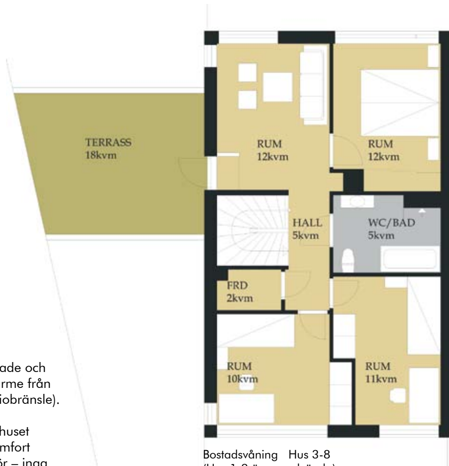
Bostadsvåning Hus 3-8 (Hus 1-2 är spegelvända) Skala 1:100

Huset är välisolerat och värms med fjärrvärme från Alingsås Energi (biobränsle).