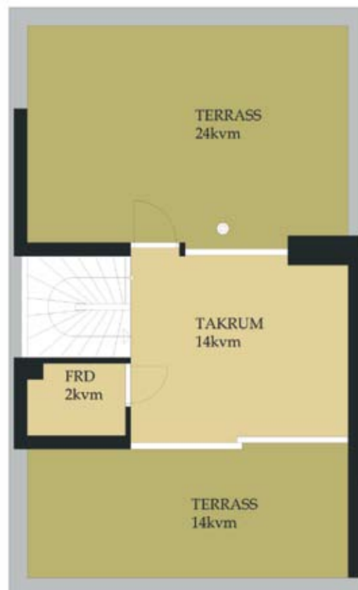
Takateljé & takterrasser Hus 7-8 Skala 1:100

Hus 7-8 ökar till ca 155 kvm i tre plan. Dessa två hus får ett penthouse – ett glasat ateljérum på tredje våningen med utgång till två stora insynsskyddade takterrasser med fantastisk utsikt.