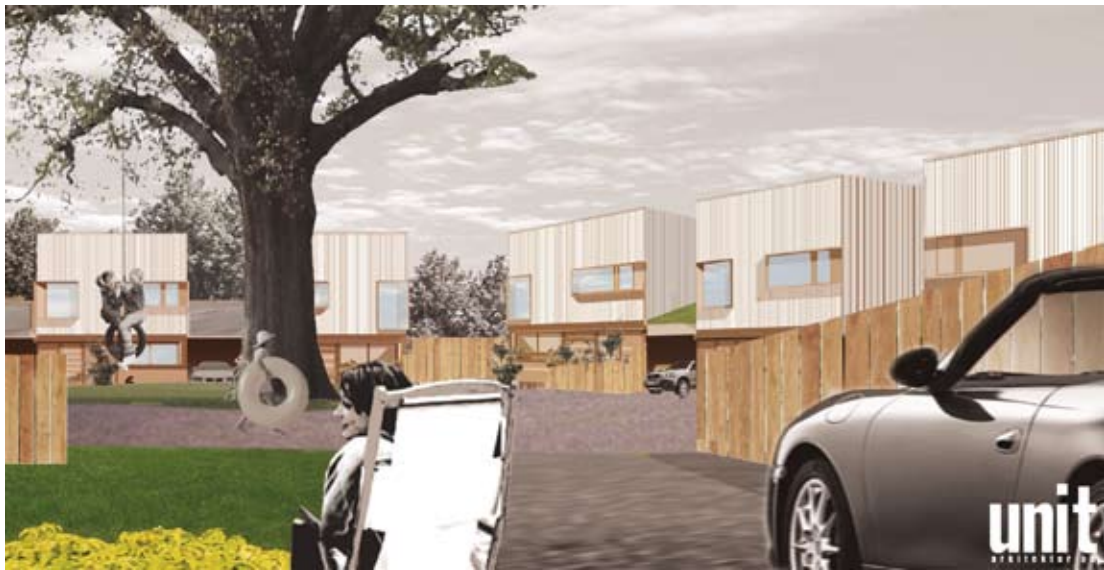
Gården innesluts av en låg enplansbyggnad mot Ekhagegatan. Här kan barnen leka tryggt med uppsyn från husen.

Varje hus har en privat takterrass på andra våningen samt två uteplatser – en utanför köket in mot kullen, en utanför vardagsrummet ut mot naturen och Mjörn.