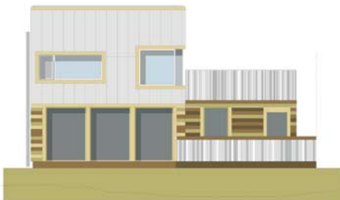
Fasad mot natur Hus 1-6

Husen har fått ett skandinaviskt modernt och stramt uttryck. På så vis förnyar vi vår träbyggnadstradition och låter husens formspråk ta oss med in i 2000-talet.