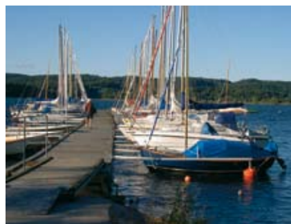
Bryggan i segelbåtshamnen